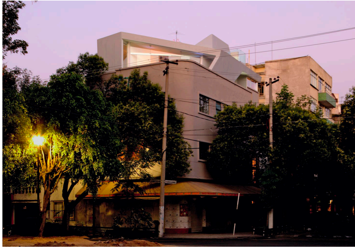
Straßenansicht Street view