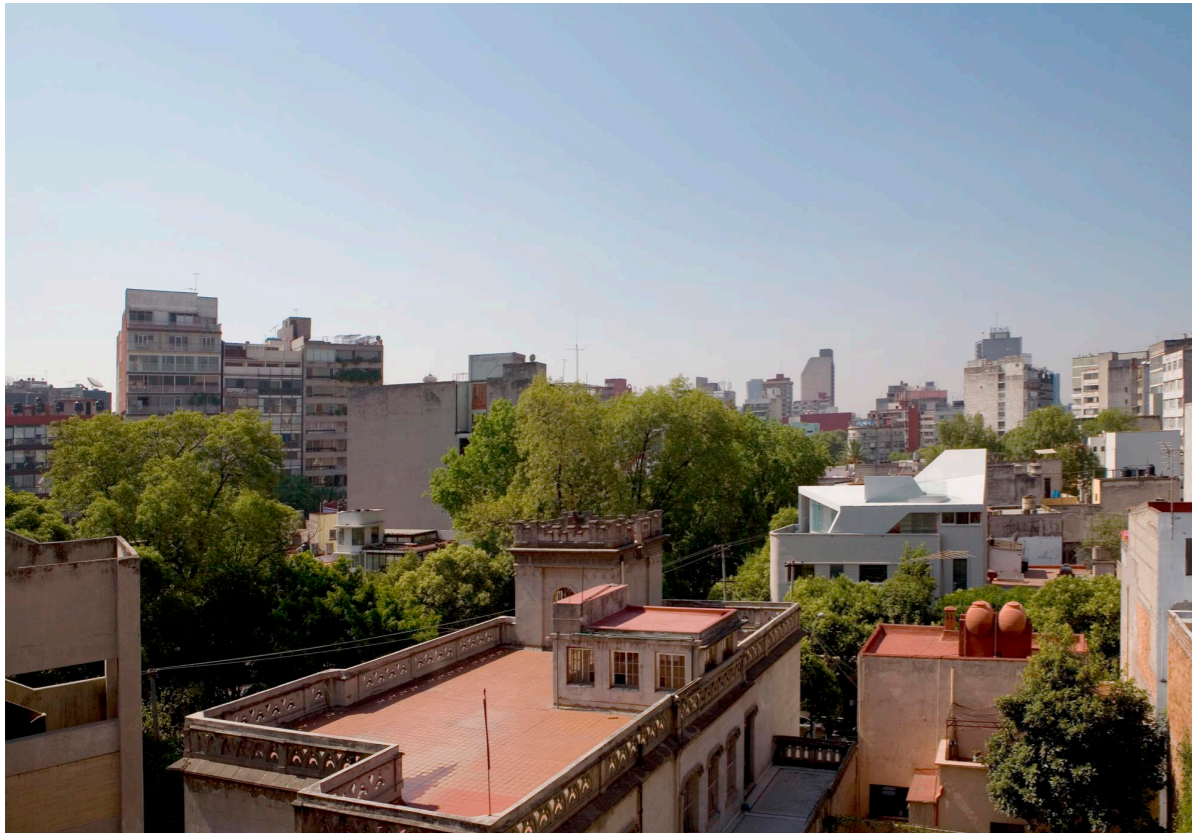
Luftbild Aerial view