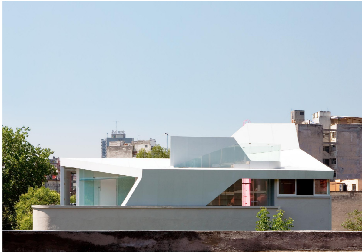
Nordansicht North view