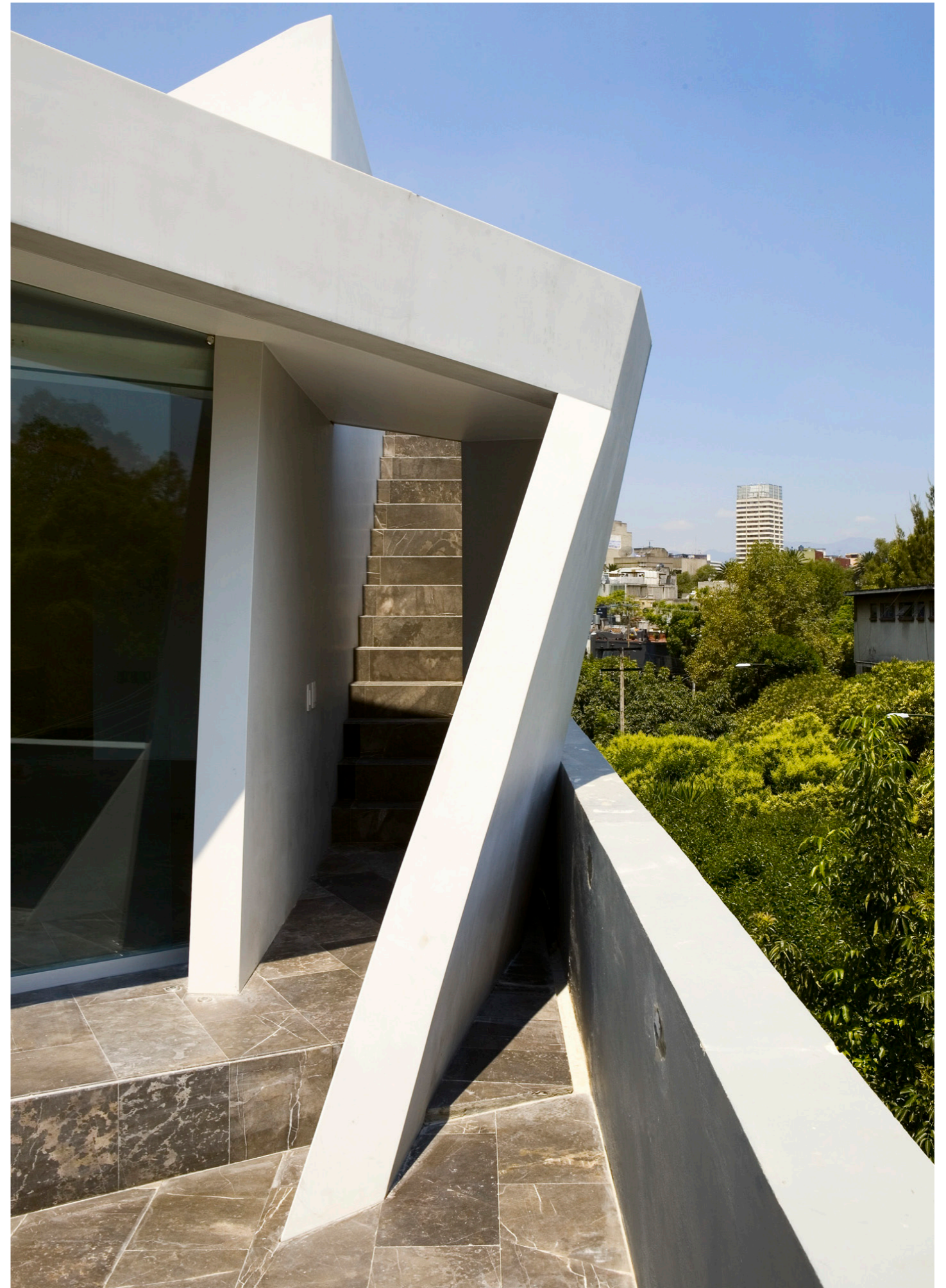
Treppe / Terrasse Stairway / Terrace