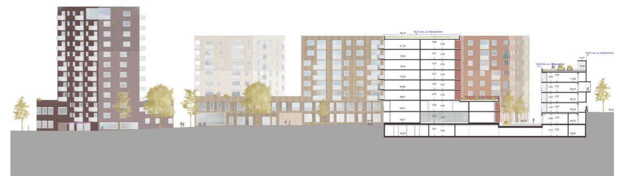
Schnitt A-A Section A-A