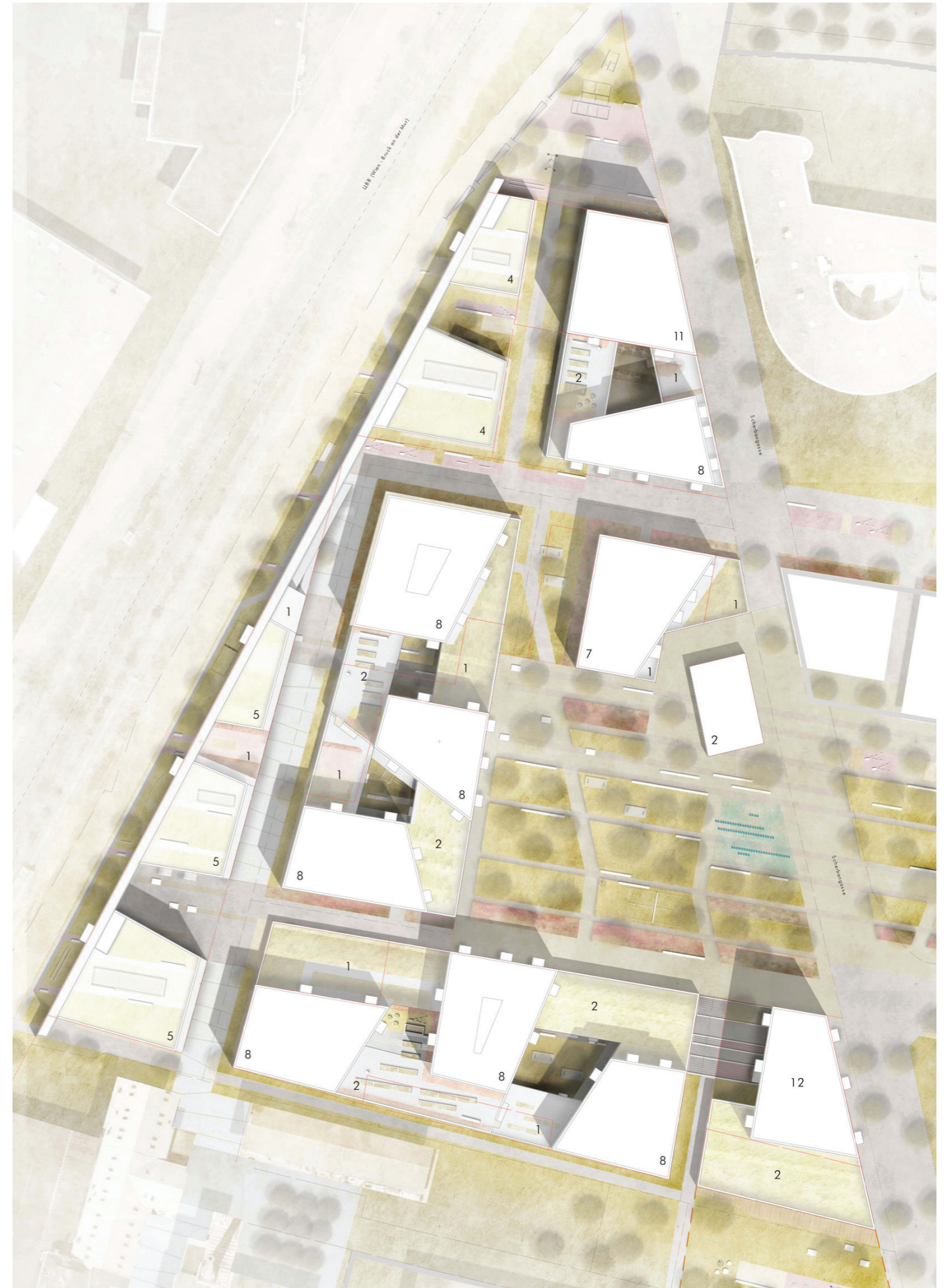
Lageplan Site plan