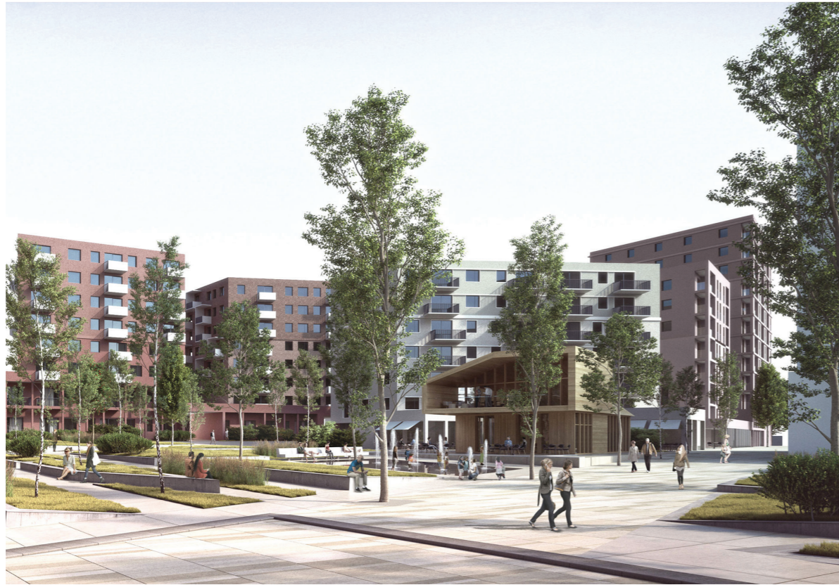
Öffentlicher Raum Public space