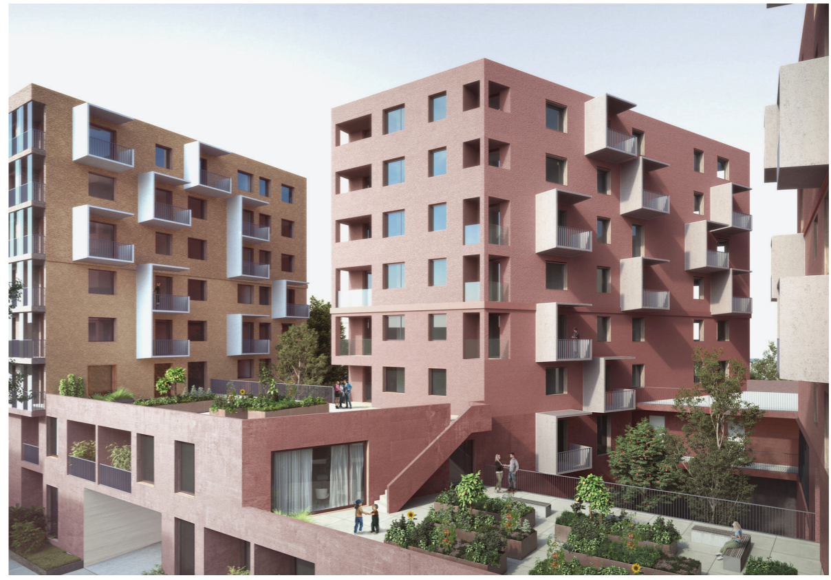
Grüne Innenhöfe Green courtyards