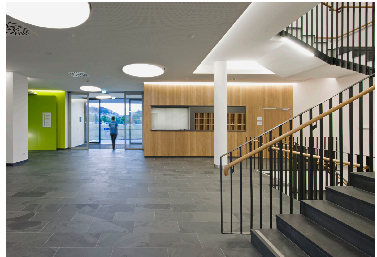
Rezeption / Foyer Reception / Foyer