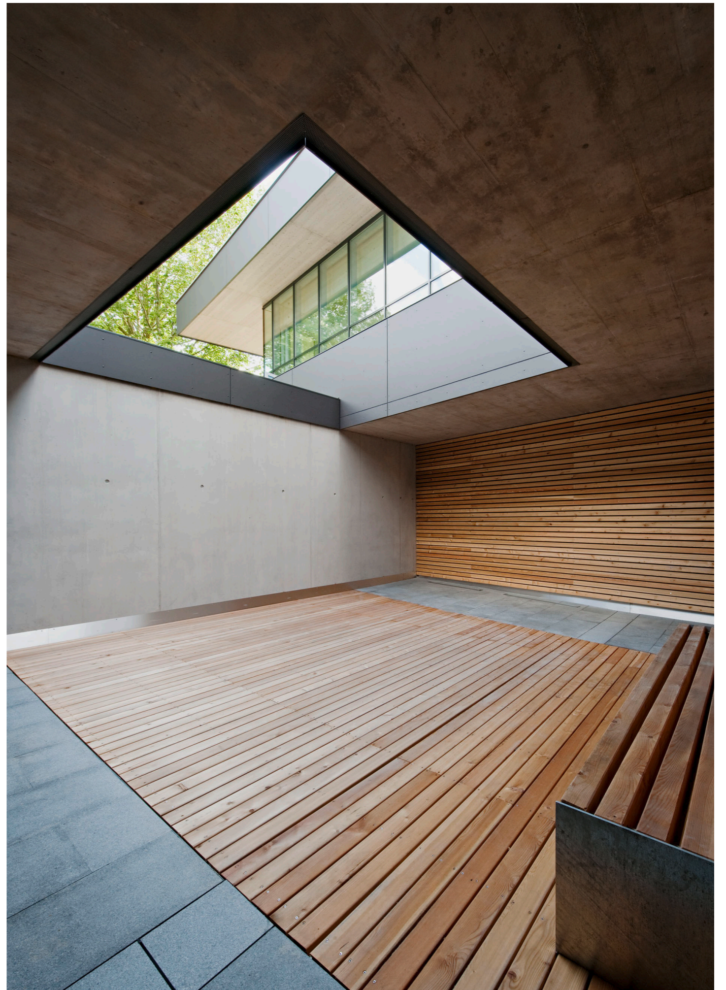
Saunahof Sauna courtyard