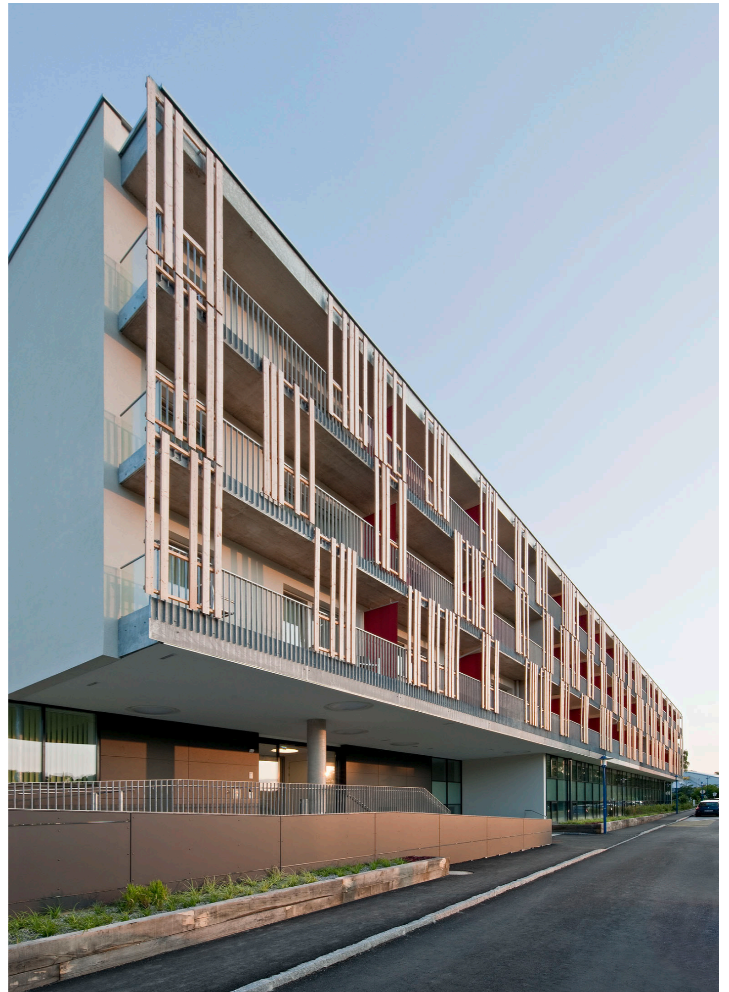
Nordfassade North facade