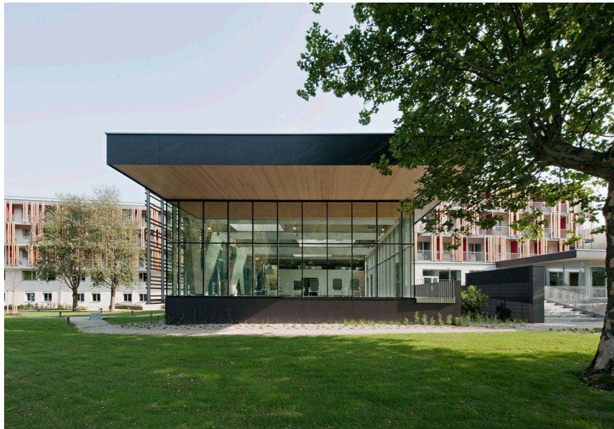
Therapiebad - Blick vom Park Therapy pool - view from the park