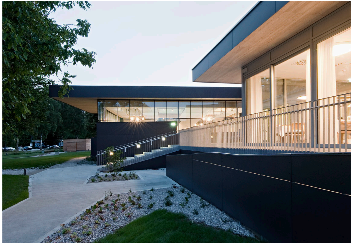
Eingang vom Park Entrance from the park