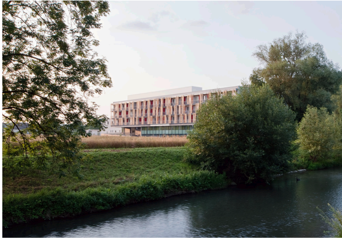
Nordfassade North facade