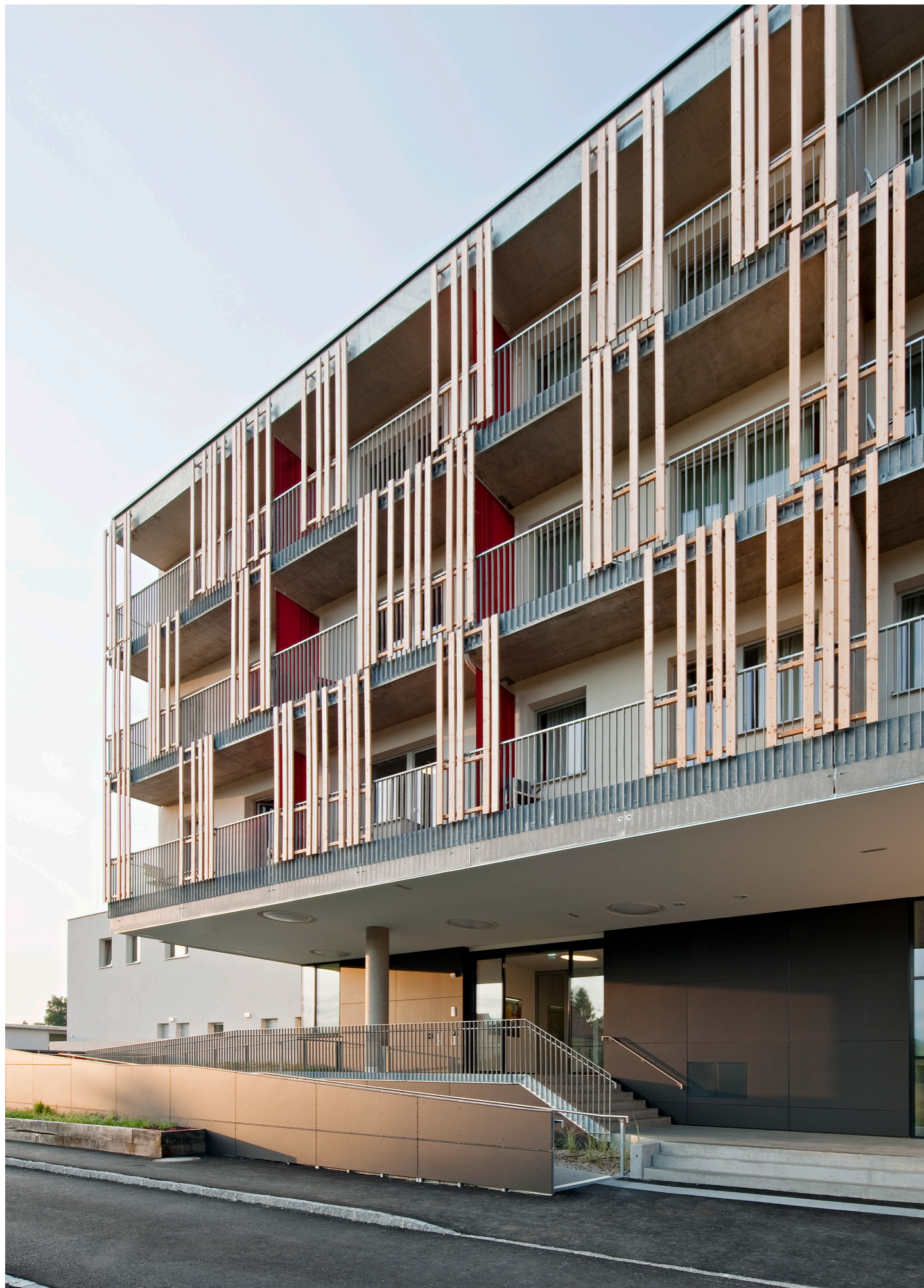
Haupteingang Main entrance