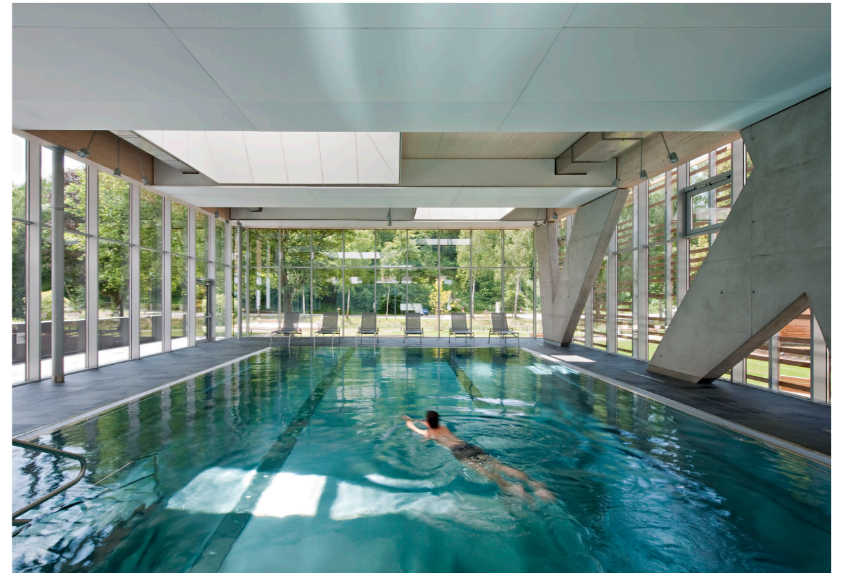
Blick von der Schwimmhalle zum Park View from swimming pool to park